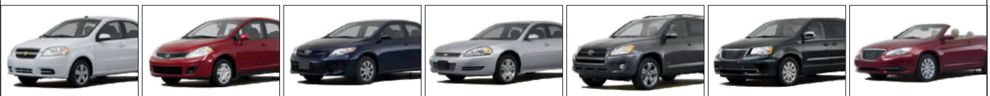
A - Economy